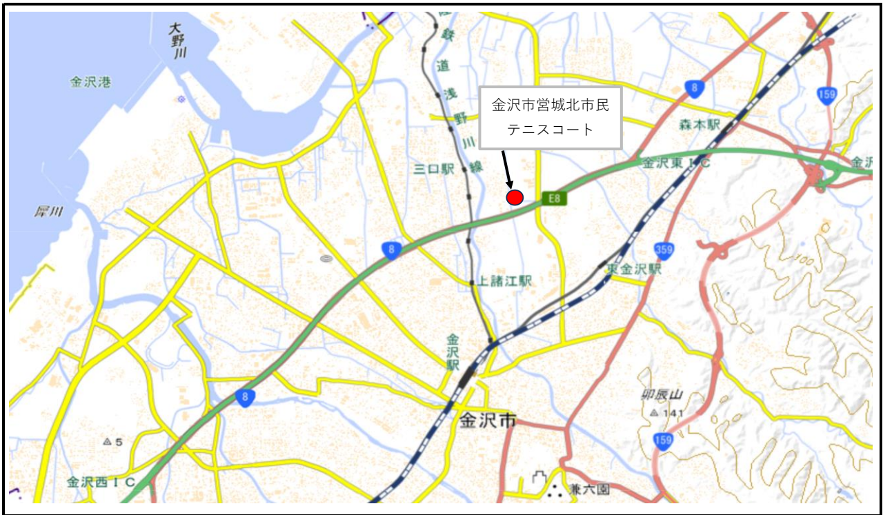
金沢市営城北市民テニスコート